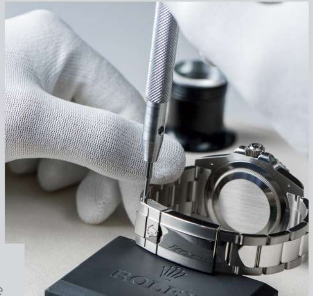
Atelier d'horlogerie agr e ROLEX