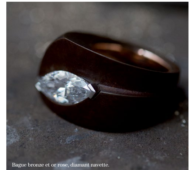
Bague bronze et or rose, diamant navette.