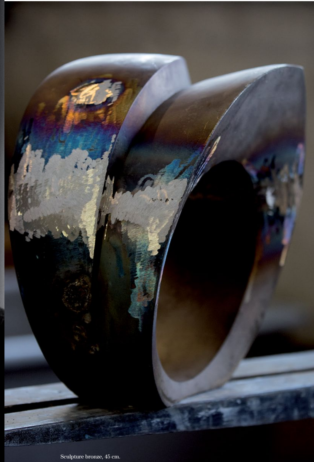
Sculpture bronze, 45 cm.