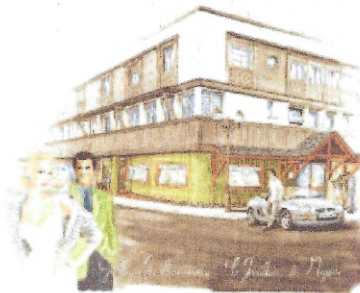
Légende à faire Lorem ipsum dolor sit amet, consectetur adipiscing elit. Sed non risus.

Après avoir vécu aux Etats-Unis, c'est à Megève qu'il décida de s'installer en 1998 pour mener à bien un projet lui permettant d'exprimer pleinement toutes ses passions.